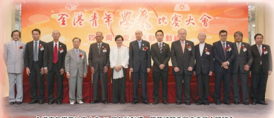
全港青年學藝比賽大會 40 周年啟動禮，學藝統籌委員會委員合照留念。