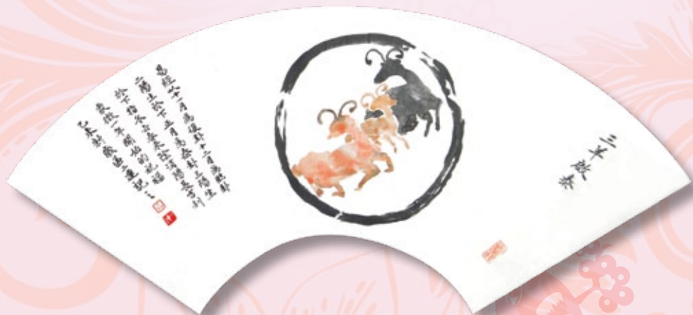
區二連女士（扇面）撰及畫