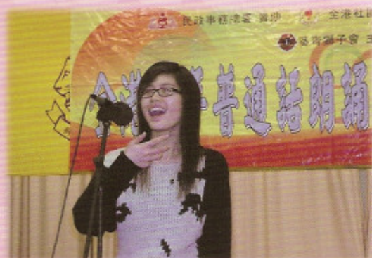
高中組參賽同學悉力以赴