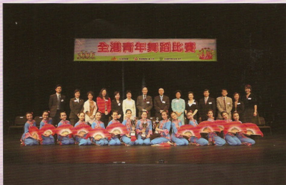
保良局董玉娣中學合照

參加是次比賽，能夠獲獎當然開心，但更重要的是能夠通過排練，令我們學校舞蹈隊更加團結，隊員之間相處得更好。希望在下年的比賽中所學得更多、更多。