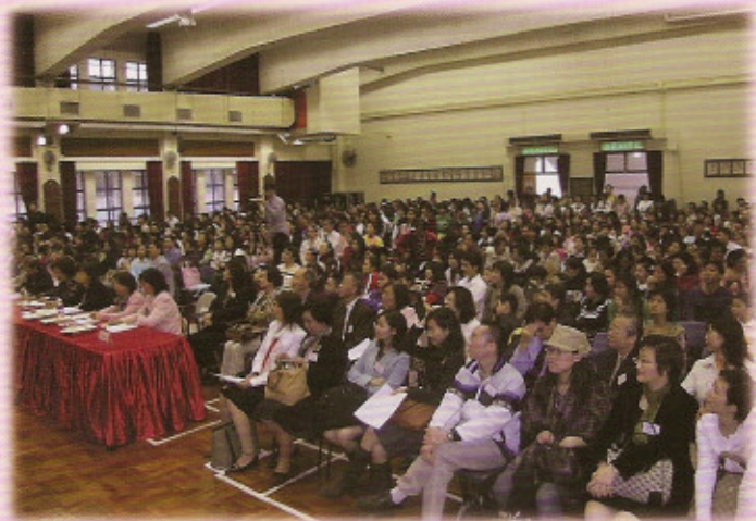
評判及觀眾全神貫注觀賞決賽

今年三月二十五日，由香港葵青獅子會主辦的普通話朗誦比賽(公民教育)已在獅子會中學順利舉行。