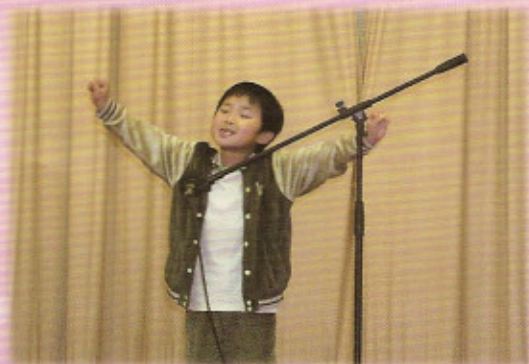
初小組參賽者表演生動

最後，是令大家留下深刻回憶的遊戲環節，台下觀眾被林月秀博士和孫方中校長邀請到台上一齊參與急口令，還猜謎語，台上台下都玩得不亦樂乎，剛才緊張的比賽氣氛頓時變得輕鬆。相信下一年的比賽，落敗的會捲土重來，而勝出的仍會問鼎冠軍寶座，加上新一批聞風而至的參賽者，比賽的競爭會更加激烈，更加精彩，讓我們拭目以待吧！