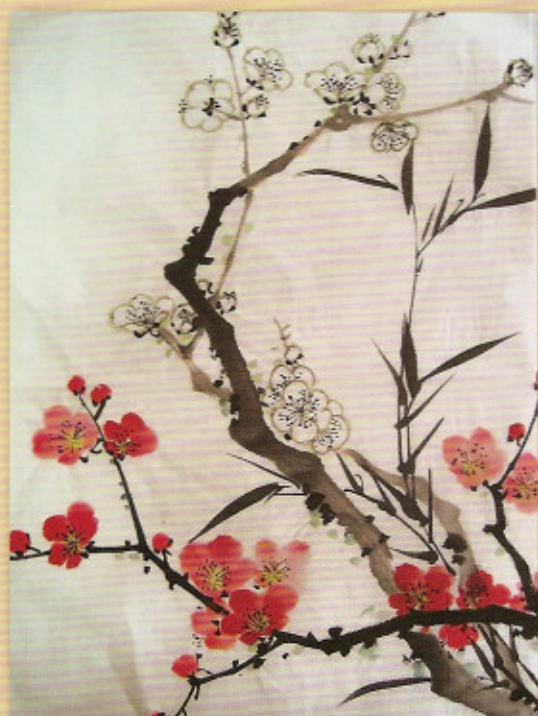
竹梅圖 第二十四屆、二十五屆繪畫比賽 國畫中學組優異獎 朱少程