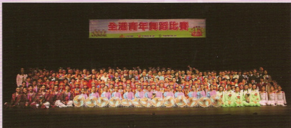
眾嘉賓與比賽隊伍大合照留念

由民政事務總署贊助，全港青年學藝比賽大會及香港環球獅子會主辦，香港學界舞蹈協會協辦的全港青年舞蹈比賽已於三月十四日起一連三天假葵芳葵青劇院演藝廳舉行，是次