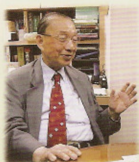
岑才生永遠榮譽會長談笑風生

在一個烈日和暴雨下的星期六下午，筆者與「青年學藝社」三位編輯，懷著恭敬而興奮的心情，聯袂訪問名冠遐邇，享譽文化界，前《華僑日報》總經理、現任香港中文大學校董、「全港青年學藝比賽大會」創辦人兼永遠榮譽會長岑才生SBS太平紳士。