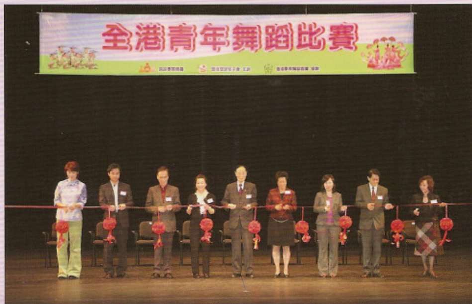
主任委員聯同嘉賓為比賽剪綵開幕

雖然是首屆舉辦此類比賽，但參賽學校演繹水準高超，豐富的節目、亮麗的服裝道具，都給大家留下了難以忘懷的印象，由此，也使我們對香港舞壇的未來充滿了希望。