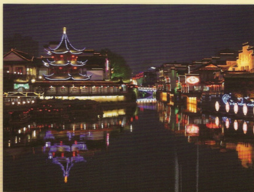
夫子廟河夜景 第三十屆攝影比賽學生組冠軍 黃德棠